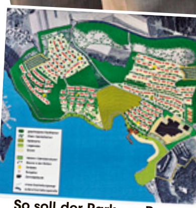
So soll der Park am Bostalsee angelegt werden