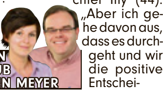
Von KATRIN EICHENLAUB und STEFFEN MEYER

Doch hinter den Kulissen laufen die Planungen jetzt schon auf Hochtouren für den Sonnenpark. Die Anlage mit 500 Ferienhäusern soll nach Informationen des SR im April oder Mai 2013 eröffnet werden. Illy bestätigt BILD: „Geht alles gut, beginnen wir mit dem Bau noch in 2010.“