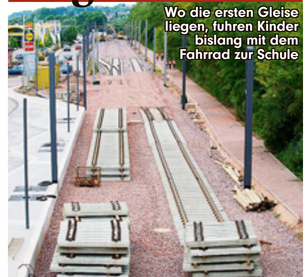
Wo die ersten Gleise liegen, führen Kinder bislang mit dem Fahrrad zur Schule