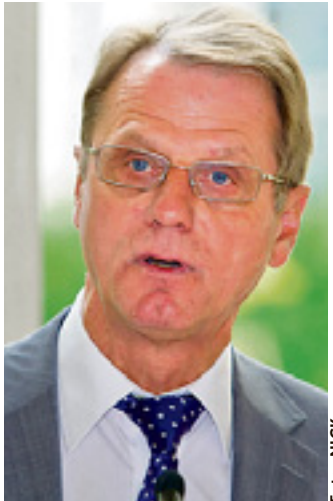
Denkt über die Zukunft der saarländischen Schulen nach: Bildungsminister Kessler

Für denkbar hält Kessler aber auch ältere Methoden, wie die Unterbringung von Schülern verschiedener Jahrgänge in einem Klassenraum.